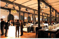
Magazin in der Heeresbäckerei