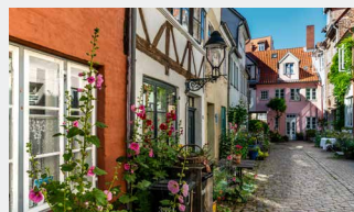
Romantische Seitenstraßen in der Innenstadt