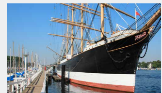
Viermastbark Passat Strandpromenade in Travemünde